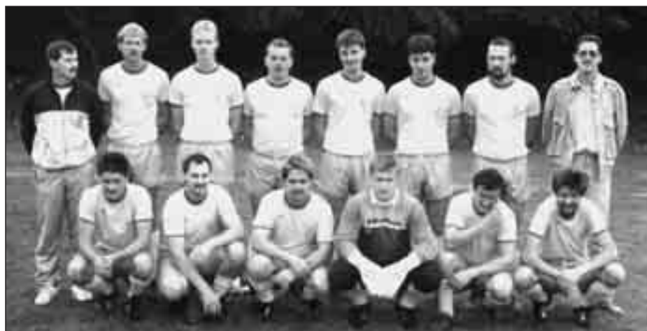
Saison 1989/90 - 2. Mannschaft SG Badem/Kyllburg

Im April 1990 wird eine weitere wichtige Entscheidung getroffen. Einem Antrag des SV Gindorf-Orsfeld, der SG Badem/Kyllburg ab der Saison 1990/91 beizutreten, wurde in einer Sitzung des Verwaltungsrates der SG entsprochen. Entsprechende Vereinbarungen werden am 15.05.90 durch die Vereinsvorsitzenden unterzeichnet. Die SG trägt somit ab der Spielzeit 1990/91 den Namen "SG Badem/Kyllburg/Gindorf".